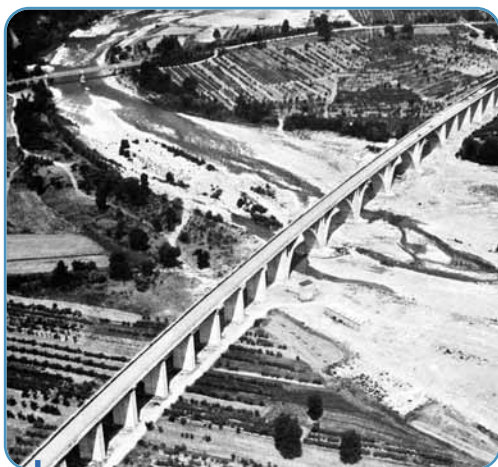
200 km de la ligne à grande vitesse Florence / Rome reposent sur un sous-ballast bitumineux.

... nobles, ce qui n'est pas négligeable. L'essai a donc été conçu pour permettre de vérifier d'une part la traficabilité de la plate-forme pour les engins routiers qui précèdent la pose des voies et, d'autre part, la tenue du matériau sous les sollicitations des trains à grande vitesse en termes de performances mécaniques, de comportement et de durabilité. Si tout cela s'avère concluant, cette solution pourrait se développer dans certaines configurations, notamment lorsqu'il y a des déficits de matériaux et des optimisations de profil à rechercher."